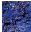
Blue garden 40 x 40 cm. c/u. Año 2010/11 Mixta / Impresión metacrilato (I/XX) Numerado y firmado