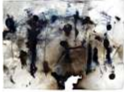
Composition on prussian blue Dimensiones: 56 x 76 cm. Año 2011