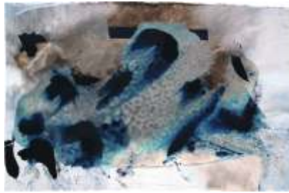
Composition on prussian blue Dimensiones: 103,5 x 153,5 cm.