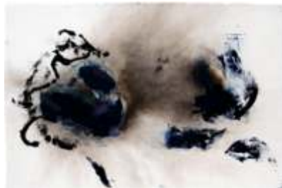
Composition on prussian blue Dimensiones: 103,5 x 153,5 cm.