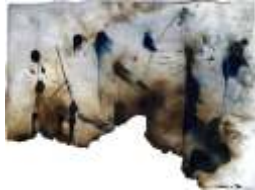
Composition on prussian blue Dimensiones: 56 x 76 cm. Año 2011